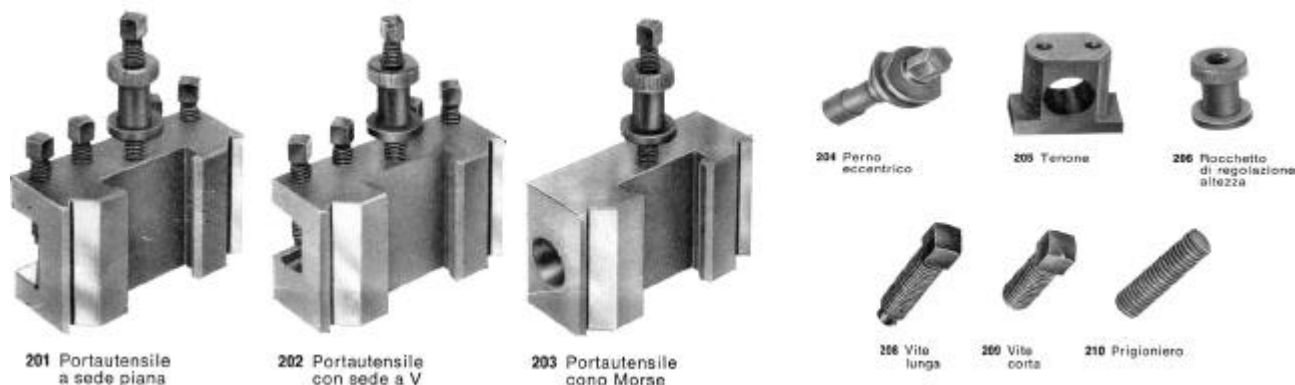
Figure degli accessori e ricambi a catalogo e fuori catalogo: