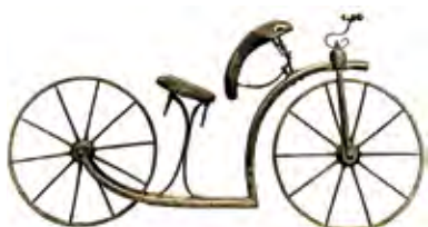
Versione di draisina del 1817, realizzata da Karl Drais