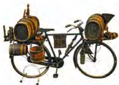
Bicicletta ed antichi mestieri, inizio '900: bici del burraio