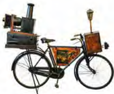
Bicicletta ed antichi mestieri, inizio '900: bici del fotografo