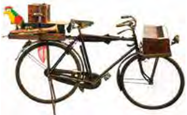
Bicicletta ed antichi mestieri, inizio '900: bici del cantastorie