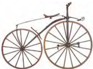
Velocipede realizzato nel 1861 da Piere Michaux