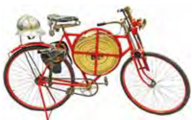
Bicicletta ed antichi mestieri, inizio '900: bici del pompiere