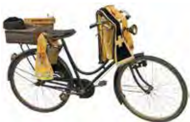
Bicicletta del prete, inizio '900