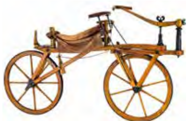
Versione di draisina del 1818, realizzata da Karl von Drais