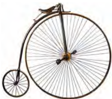
Biciclo inventato nel 1869 dal francese Eugène Meyer