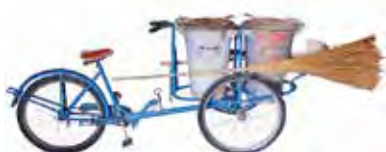
Bicicletta ed antichi mestieri, inizio '900: bici dello spazzino