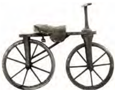
Laufmaschine (macchina da corsa) creata nel 1816ww da Karl Drais(*)