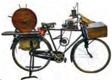
Bicicletta ed antichi mestieri, inizio '900: bici dell'arrotino